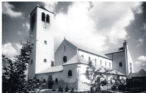
De O.L.-Vrouw-van-Lourdeskerk in het Wittevrouwenveld, 1947.