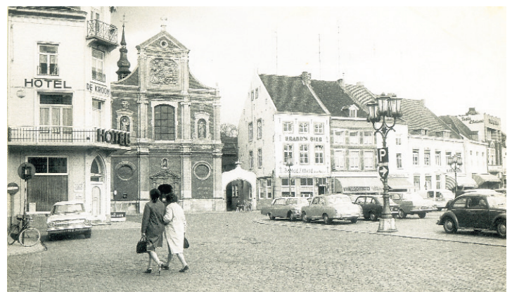
De Sint-Michaëlskerk in Sittard.